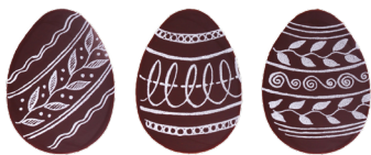
Oster-Ei 3er Set