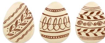
Oster-Ei 3er Set

Art.-Nr.: 53898 VpEh: Karton à 240 Stück