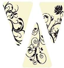
Dreieck weiss Floral

Art.-Nr.: 58674 VpEh: Karton à 180 Stück